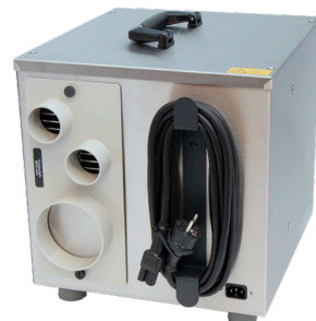
Odvlhčený vzduch je možné vyfukovať cez jeden alebo dva otvory