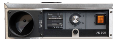
Ovládací panel (AD 300)