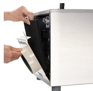
Vzduchový filter je možné vymeniť bez nutnosti otvárania skrine